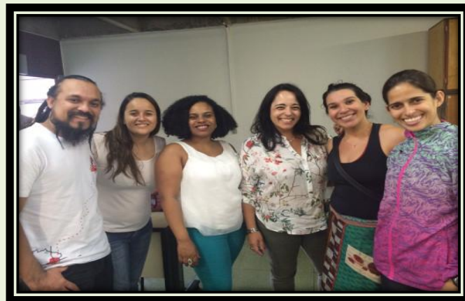
Membros do Grupo GESPEL

O Grupo de Estudos de Sociologia e Pedagogia do Esporte e do Lazer (GESPEL), da UFMG, dedica-se a estudar os fenômenos atuais do esporte, da saúde e do lazer, influenciados pela educação olímpica. Centra-se em analisar e discutir temas de abrangência e emergência social, que tenham como foco a formação humana, em todos os seus vieses. É um Grupo de repercussão nacional e internacional e visa buscar parcerias com organizações governamentais e da sociedade civil, além de instituições educacionais.