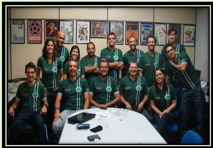
Participantes do GEFuT

O Grupo de Estudos sobre Futebol e Torcidas (GEFuT), da EEFETO/UFMG, tem, desde 2006, se debruçado sobre temas correlatos ao futebol e as torcidas, como: futebol e estádio; torcida e violência; o torcer no futebol profissional e amador; a relação das torcidas com o Estatuto do Torcedor; torcida e gênero; futebol e educação; a história das torcidas; futebol e profissionalização; futebol e formação, além do futebol virtual. O grupo é composto por estudantes, graduados, mestres e doutores, que têm em comum a paixão pelo futebol.