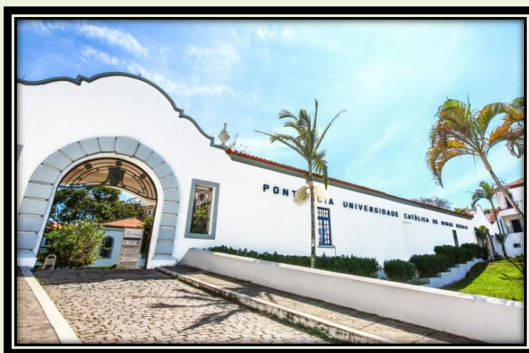
Pontifícia Universidade Católica de Minas Gerais (PUC MINAS)

O Centro de Estudos de Educação Física, Esporte e Lazer (CEEFEL), da PUC Minas, foi criado em 2005 e concentra seus estudos na área da saúde. O Grupo está cadastrado no Diretório de Grupos de Pesquisa do CNPq e certificado pela Pró-Reitoria de Pesquisa e Pós-Graduação da PUC Minas. Tem como finalidade ampliar o conhecimento, viabilizar, realizar e publicar pesquisas em nível de graduação e pós-graduação na Educação Física, no Esporte e no Lazer. A criação do CEEFEL justifica-se pela Lei de Diretrizes de Bases da Educação Nacional (LDB/1996), que desafia a participação dos discentes, docentes e da população em geral na construção e difusão de conquistas e benefícios resultantes da criação cultural, da pesquisa científica e dos avanços na produção dos conhecimentos e tecnologias gerados na e com a Universidade.