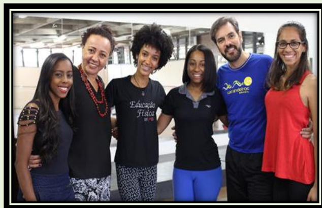
Integrantes do Grupo EduDança

desenvolvem pesquisas e ações de extensão, como fóruns de debate, minicursos e palestras.