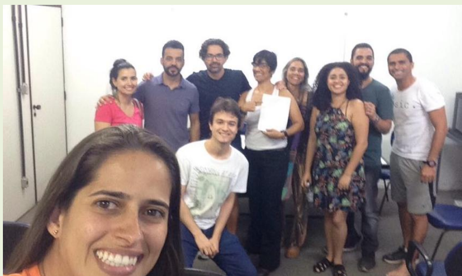
Integrantes do Oricolé

Pesquisa vinculada ao Centro MG da Rede CEDES: "Esporte, lazer e formação profissional: análise da trajetória e da construção do saber de gestores do Programa Esporte e Lazer da Cidade (PELC)"