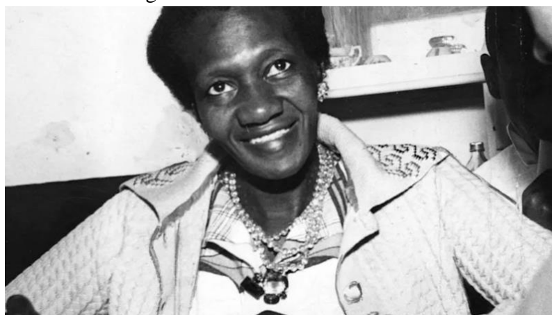
Figura 3 - Carolina Maria de Jesus