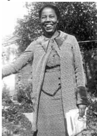
Figura 2 - Antonieta de Barros