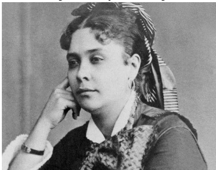
Figura 4 - Chiquinha Gonzaga

Chiquinha Gonzaga, nascida em 17 de outubro de 1847, foi uma personalidade extremamente importante no que toca às artes. Foi a primeira mulher a reger uma orquestra no Brasil, foi compositora, pianista e maestrina. Autora da primeira marchinha de carnaval, famosa até os dias atuais “Ó Abre alas”. Dada a sociedade patriarcal de sua época, Chiquinha Gonzaga tornou-se uma importante personalidade no século XIX, além de seu protagonismo enquanto mulher, ela desafiava os padrões da época também por suas ideias abolicionistas.