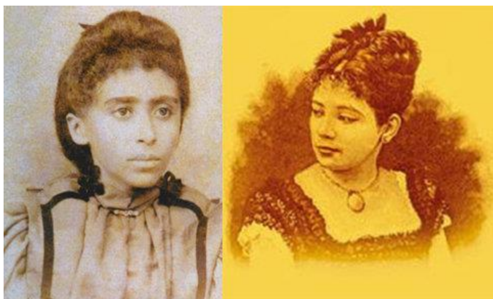
Figura 6 - Maria Firmina dos Reis