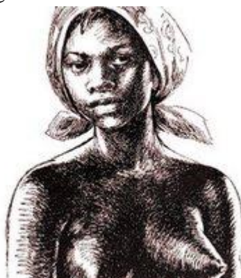
Figura 5 - Dandara dos Palmares

Dandara dos Palmares foi uma mulher negra, mãe de três filhos e companheira de luta de Zumbi dos Palmares. Dandara liderava as falanges femininas das guerreiras do Quilombo de Palmares, além de contribuir com os ofícios do Quilombo, como por exemplo, a produção de farinha e a caça. Ela aprendeu a lutar capoeira, bem como empunhar armas para defender o seu Quilombo, assim como Zumbi, Dandara era contra o tratado de paz assinado por Ganga-Zumba, que traria diversas modificações para o seu Quilombo.