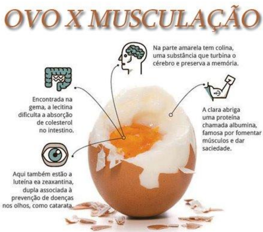
Figura 1 – Relação entre ovo e musculação